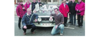
Les organisateurs peuvent être satisfaits de cette nouvelle épreuve